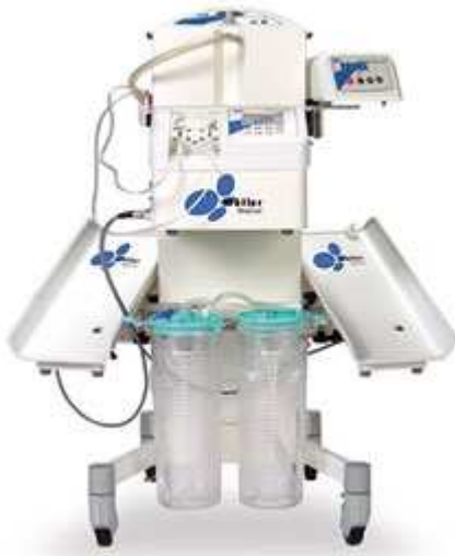
Abb. 5: Liposuktionsinstrumentarium mit Aspirator, Infiltrationspumpe und Wärmeschalen zur temperaturkontrollierten Tumescenz-Lokalanästhesie-Infiltration (LipoSat®)

Mengen ermöglicht sowie eine elektronisch kontrollierte Vorwärmung der Lösung (LipoSat®) [121].