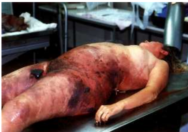
Abb. 3: Fulminanter Verlauf einer Gasbrand-Sepsis innerhalb von 20 Stunden nach ambulanter Liposuktion des Abdomens und des Rückens

Die Autopsie zeigte einen bakteriellen Befall ausgehend von der Perianalregion. Ein offensichtlicher Behandlungsfehler konnte nicht festgestellt werden.