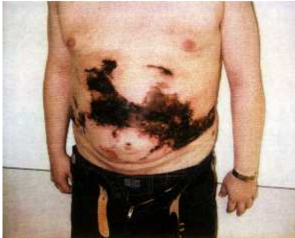
Abb. 4: Entwicklung einer abdominellen Hautnekrose 2 Tage nach Liposuktion

Alle nekrotischen Areale befanden sich im Bereich der Bauchwand. Der Patient, der in Abbildung 4 dargestellt ist, entwickelte eine abdominelle Hautnekrose 2 Tage nach der Liposuktion von 5,6 Liter in reiner Tumescenzlokalanästhesie (true-TLA).